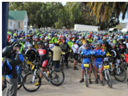
Bo: Die wegspring in Willowmore

Ons eie ontwikkelingspan (ook 'n Toerisme projek) het Willowmore se naam hoog gehou en die roete in ongeveer 18 uur voltooi. Die dag voor die groot resies het Baviaans Toerisme 'n pret-trap gehou vir inwoners en geesdriftiges waar hulle 'n hele klomp pryse kon wen, wat ook 'n nuwe fiets geborg deur Eco-Bound ingesluit het.