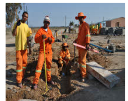
Bo: EPWP werkers in Rietbron