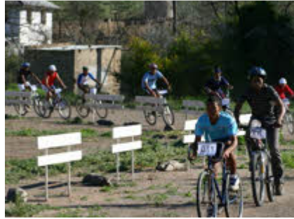
Bo: Die dikwiel resies onderweg

wen. Baviaans Munisipaliteit het die fiets gekoop, inskrywingsgeld vir voorheen benadeelde individue betaal en vir medaljes gesorg. Op hul beurt het Baviaans Toerisme fietse verskaf aan diegene wat nie hulle eie gehad het nie.