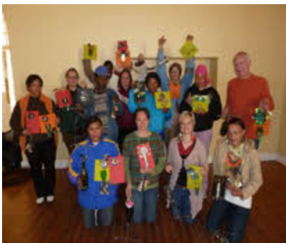
Bo: Crafters by Steytlerville se tweede werkswinkel met hulle kunswerke

Die tweede van drie reekse werkswinkels het in Augustus in Willowmore, Steytlerville en Baviaanskloof plaasgevind. Die fokuspunt was kuns uit blik en draad, waar deelnemers geleer het hoe om 'n blik blom en engel te maak, met draad te werk en hoe om 'n drinkplekkie vir voëls uit 'n ou bottel te maak. Hulle is ook meer geleer oor koste berekening en verskillende rou materiale wat gebruik kan word vir innoverende produkte.