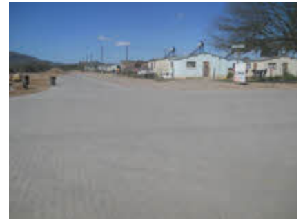
Above: A paved street in Steytlerville