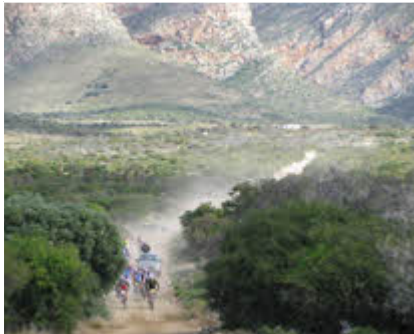
Bo: Die nuwe roete deur die Winterhoek-area

Eco-Bound se Trans-Baviaans het, soos gewoonlik, groot opwinding verskaf aan Willowmore en die omliggende omgewing. Eenduisend seshonderd fietsryers het op Vrydag, 12 Augustus 2011, Willowmore binne gestroom.