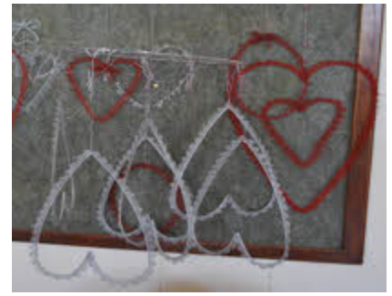
Bo: Van die groep se hande werk

Die groep, wat tans uit elf lede bestaan, neem ook jaarliks deel aan die Grahamstad Kunstefees,