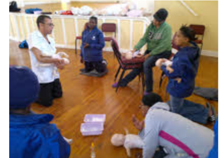
Top and above: Participants in Steytlerville busy with training, facilitated by St Johns