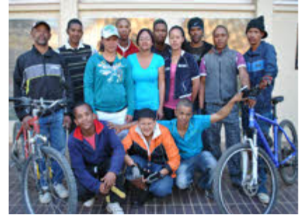
Bo: Lede van die Willowmore Ontwikkelings Fietsryspan

Hierdie jaarlikse bergfietswedren word deur Uniondale en Knysna se Lions klub gereël en alle opbrengste word aangewend vir hulle Sight First veldtog wat oogsorg vir blindes en sig-gestremdes in hulle area verskaf. Fietsryers spring in Uniondale weg en ry oor die pragtige ou wapad van die Prince Alfred pas na Knysna.