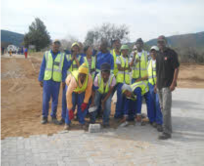
Above: The team of John Skinner Construction paving in Steytlerville

Phase 3 of the upgrading of streets and storm water drainage are underway in Willowmore and Steytlerville. The main contractor in Steytlerville is John Skinner Construction and Active