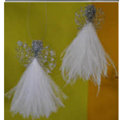
Bo en Heelbo: Van Vondeling se engeltjies