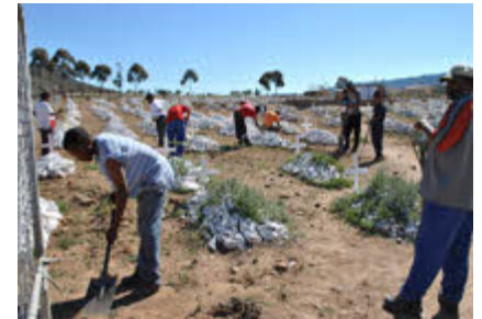
Bo: EPWP werkers in Willowmore

Tydens die boekjaar 2010/11 was die begrote bedrag vir Baviaans R870 000 terwyl R2,2 miljoen spandeer is aan tydelike werksgeleentheid. Vir hierdie poging het die Munisipaliteit R960 000 terug ontvang van die Departement.