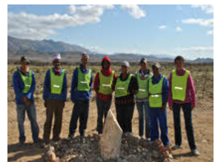
Bo: EPWP werkers in Vondeling